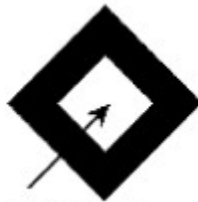
Incorporation in accordance with Art. 3